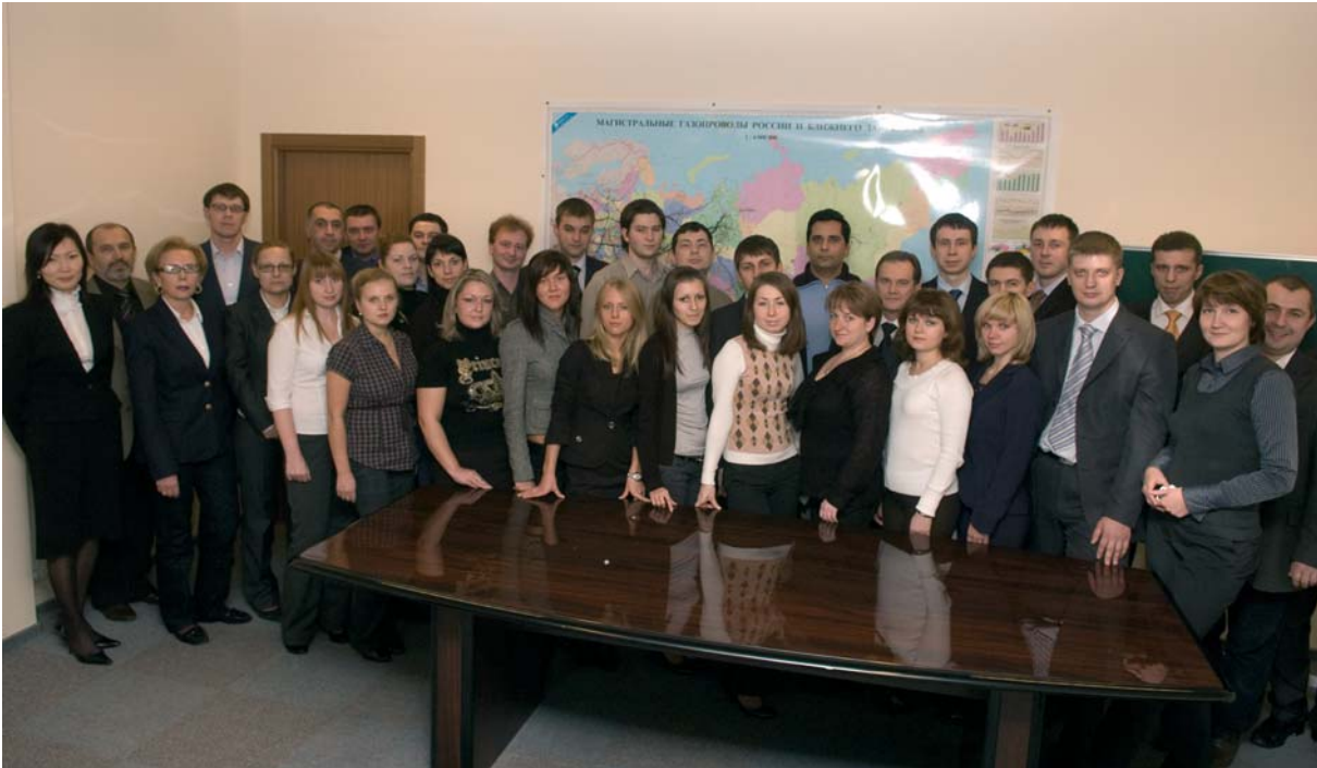
Коллектив ОАО «Межрегионэнергобыт».

Планируется снабжение электроэнергией как дочерних предприятий Газпрома, так и сторонних компаний.